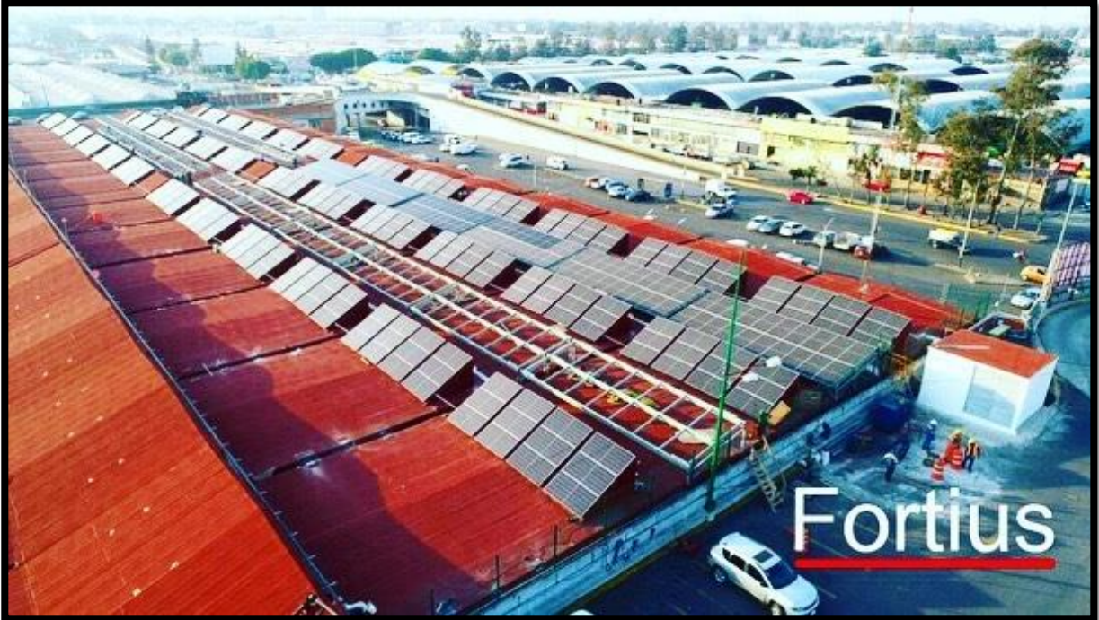
Proyecto de Central de Abastos CDMX (Fase 01)