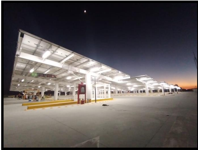
Grupo Aeroportuario del Pacífico (GAP)

Además, como empresa y con nuestro equipo de trabajo y sus familias, realizamos proyectos internos como la donación y entrega de juguetes y cobijas para los habitantes de la comunidad Ferrería de Tula, zona en la que se encuentra nuestra reserva forestal, apoyando también al desarrollo de la comunidad.