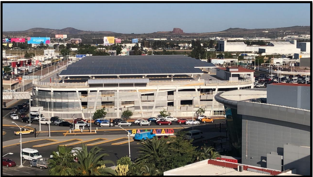
Grupo Aeroportuario del Pacífico (GAP) – Aeropuerto Internacional de Guadalajara Jalisco – Miguel Hidalgo y Costilla.