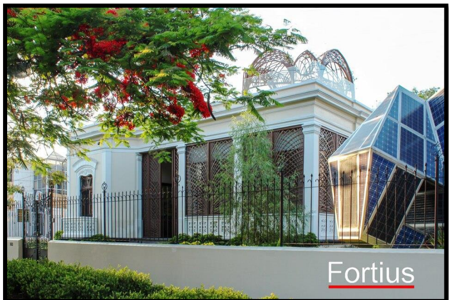
Fortius Electromecanica Oficinas 01 y 02 - Certificación LEED Platinum

nivel más alto de certificación en sustentabilidad LEED Platinum trabajando con dicho modelo desde mayo del 2013. Obteniendo el reconocimiento como la primera edificación en Guadalajara, Jalisco con el distintivo LEED – Platinum. Esto como parte de las acciones que se consideran dentro de los estándares marcados.