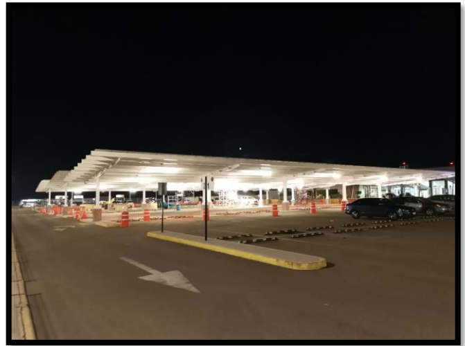
Grupo Aeroportuario del Pacífico (GAP)

Además, como empresa y con nuestro equipo de trabajo y sus familias, realizamos proyectos internos como la donación y entrega de juguetes y cobijas para los habitantes de la comunidad Ferrería de Tula, zona en la que se encuentra nuestra reserva forestal, apoyando también al desarrollo de la comunidad.