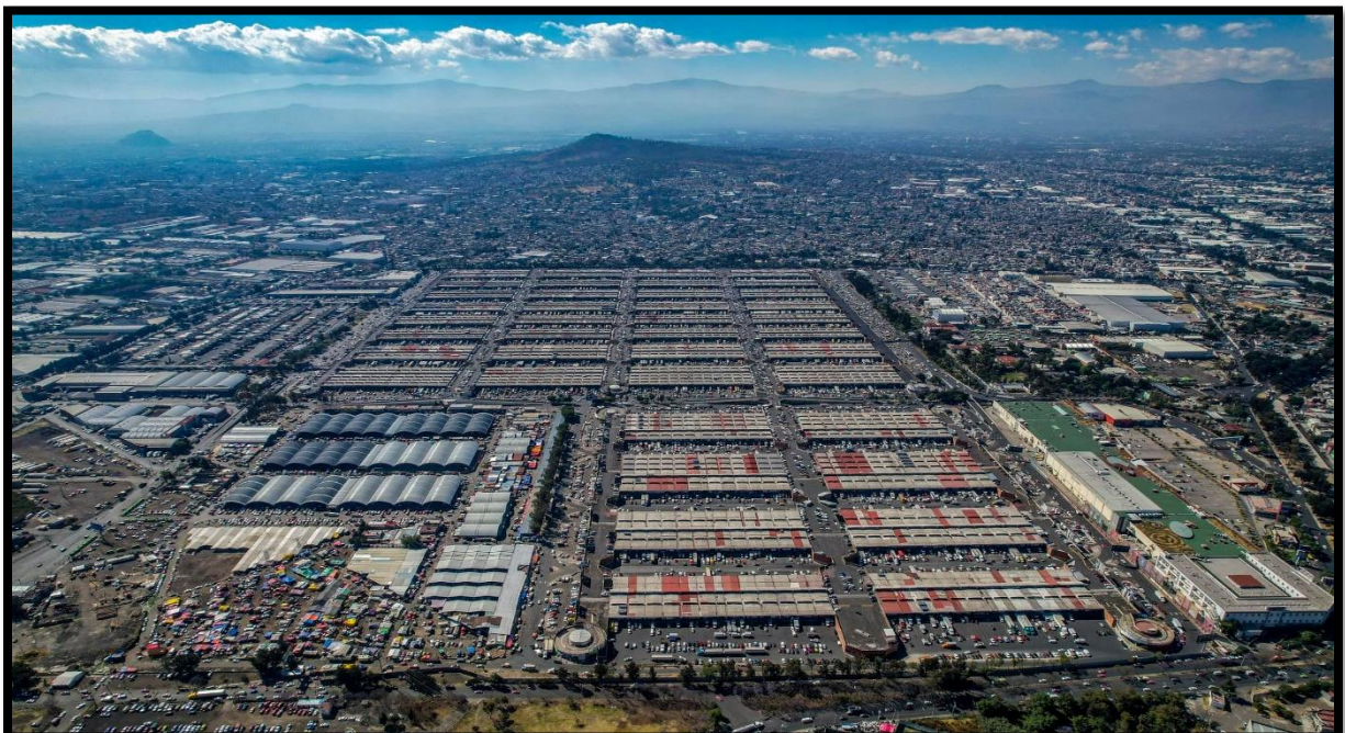
Proyecto de Central de Abastos CDMX (Fase 01)

En FORTIUS ELECTROMECHANICA trabajamos de la mano del ODS 7 energía asequible y no contaminante desde nuestra misión , proporcionando servicios de calidad a través de proyectos, instalaciones electromecánicas y de energía renovables a la vanguardia de la tecnología.